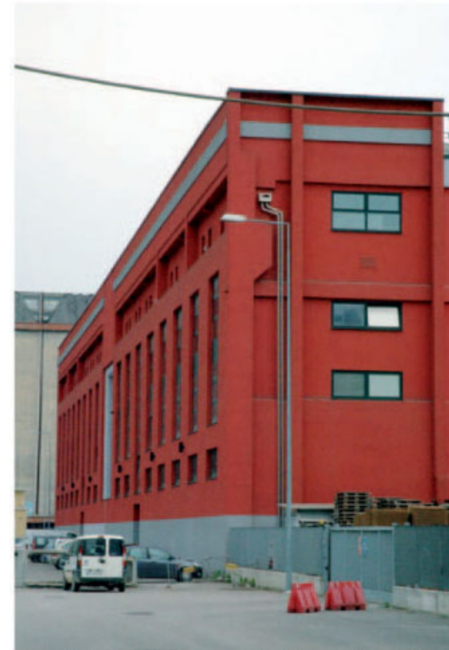
Das Studio befindet sich in einem Gewerbebau aus den Dreissigern.