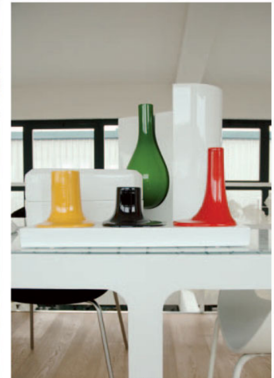
...zieren den Sitzungstisch.