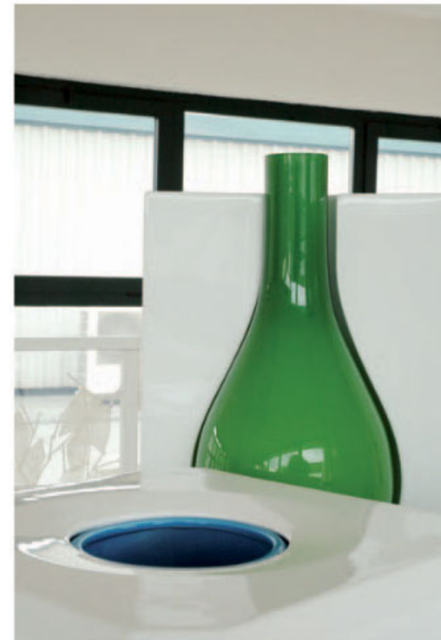
Skulpturale, mundgeblasene Glaskunstwerke...