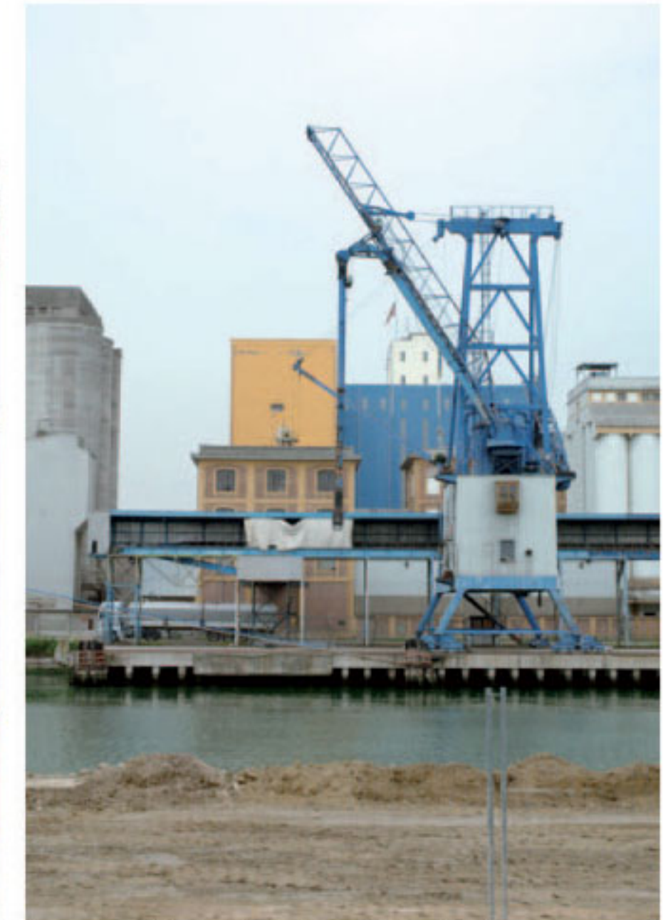
Blick auf Hafenkräne in Porto Marghera.