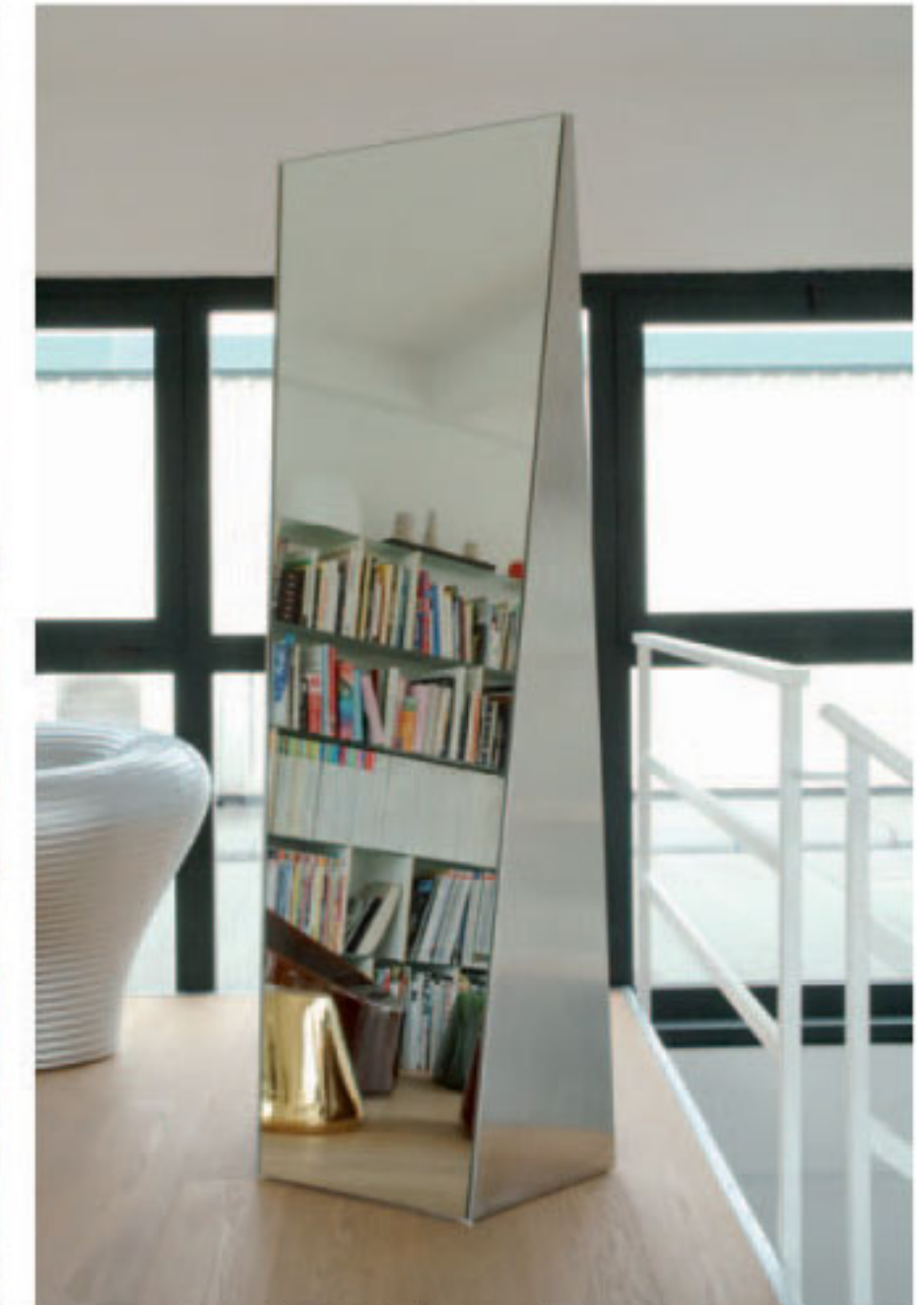
Links im Bild: Vase «Tambo» für Plust.