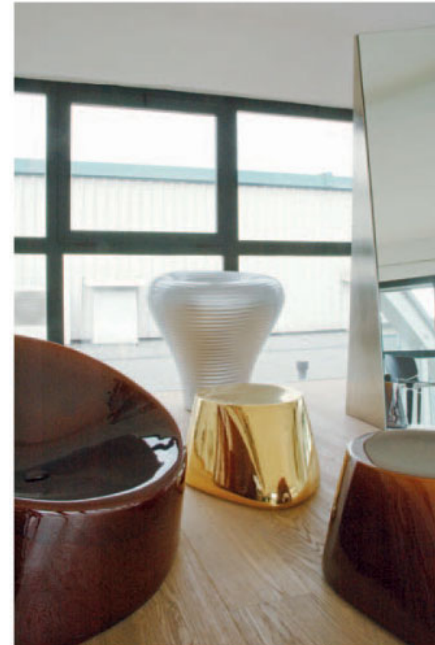
Hocker «The Fool on the Hills» aus Keramik für Moroso.