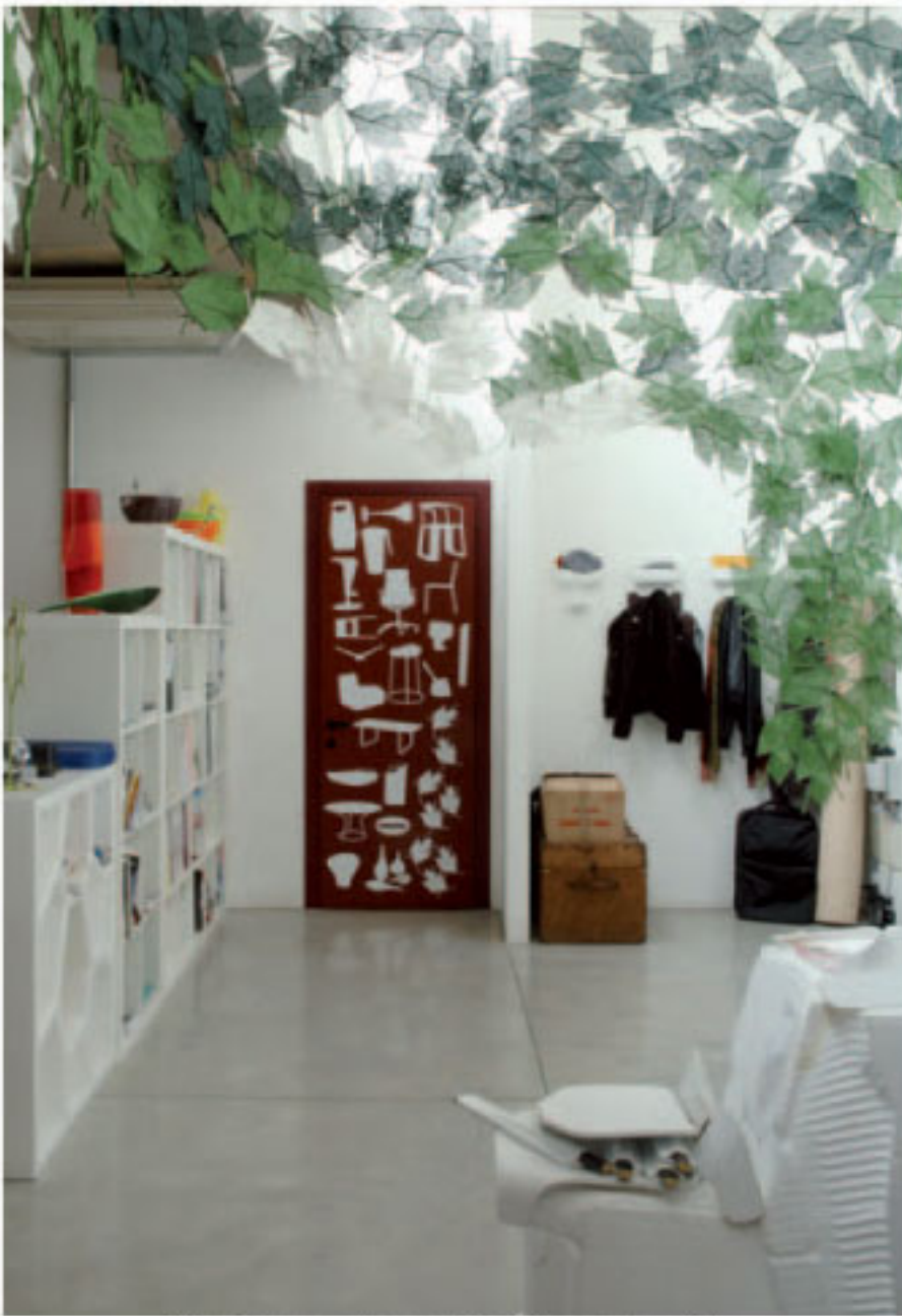
Kreative Unordnung: Der Eingangsbereich.