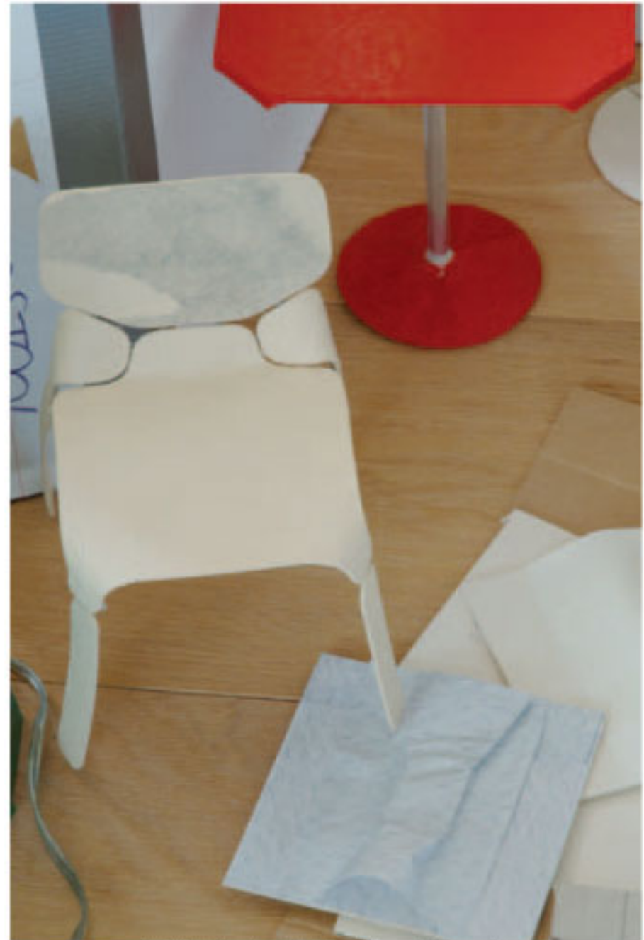
Modell für den Stuhl «Robo» (Offecct).