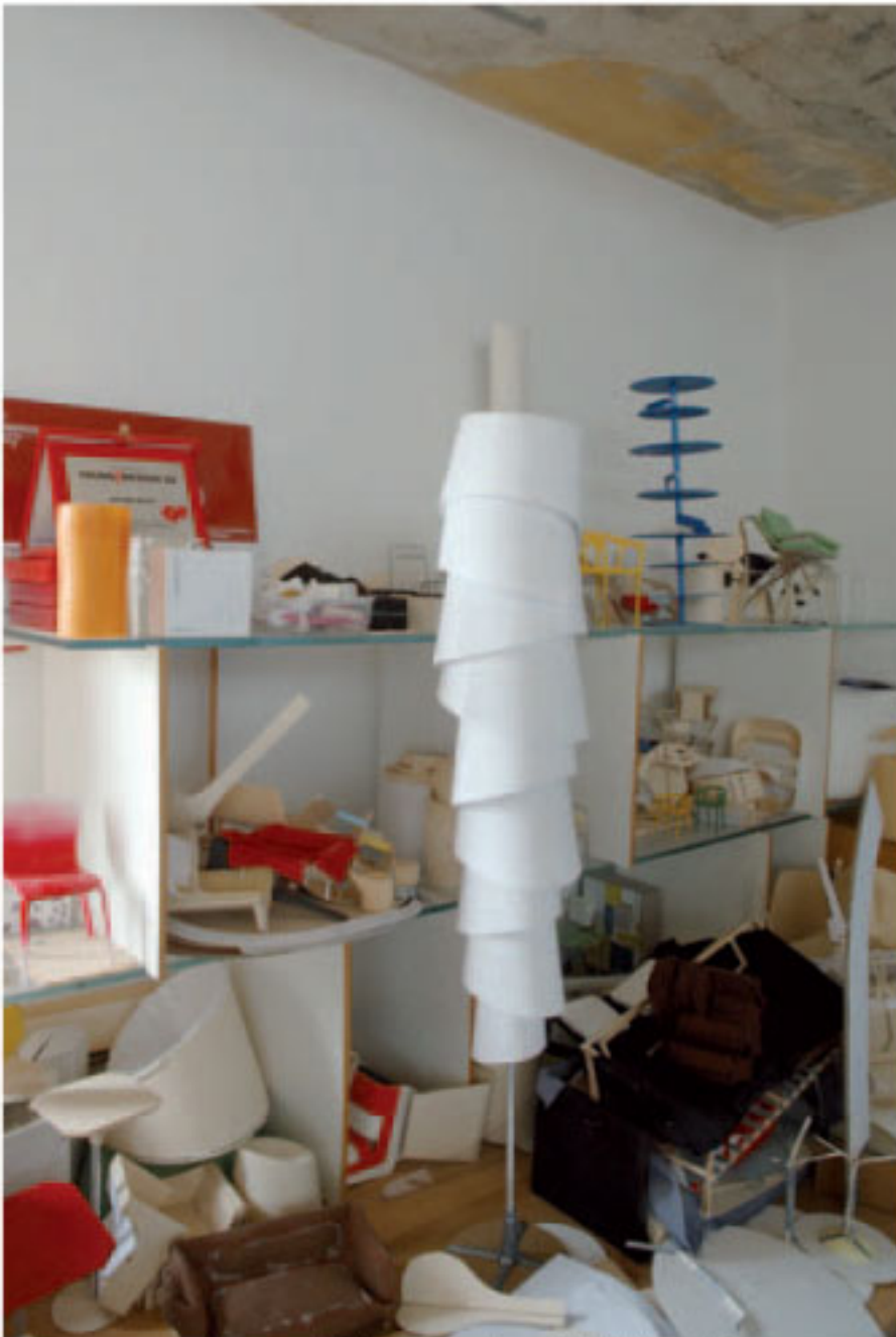
Das kreative Herzstück: Hier entstehen Modelle und Prototypen.