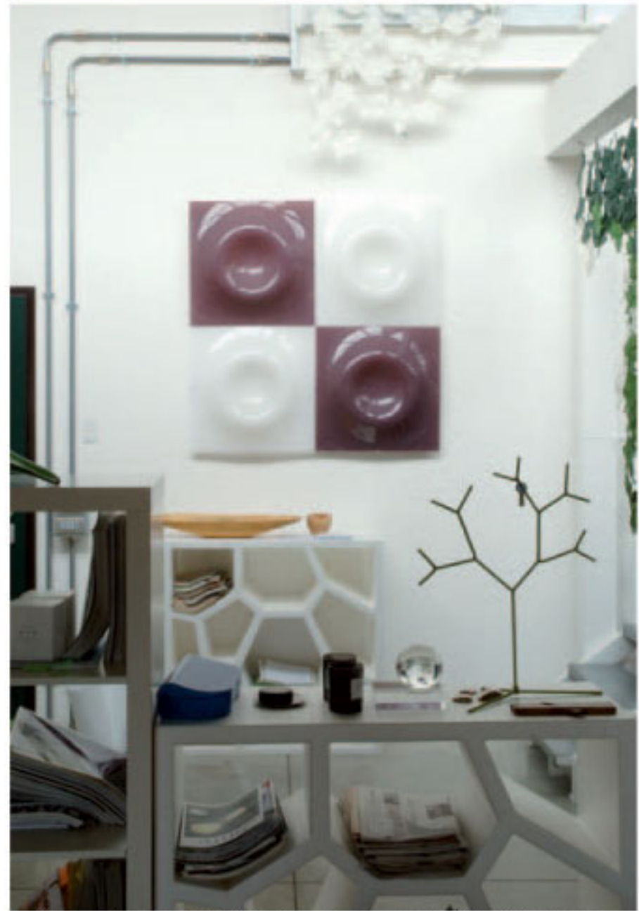
Platz gibt es auch für Schnickschnack – und viele Zeitschriften.