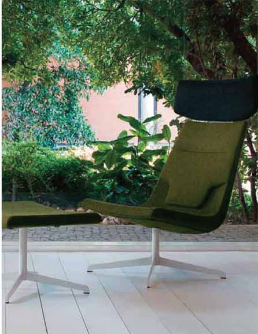
En skön stol är Elle med all säkerhet, formgiven för Emmegi.