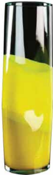
Aspirato heter denna vackra vas för Carlo Moretti. Tillverkad i flera färger med vakuumteknik i begränsade serier.