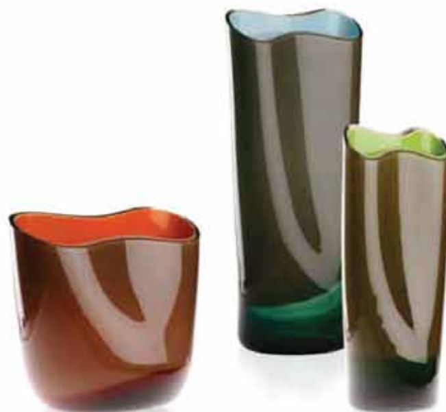
Helt ny för i år är serien Otto för Venini. Bilden visar den stora upplagan som kommer att säljas till konsument.

serad redan som barn. 1999 började jag min karriär med design för Salviati.