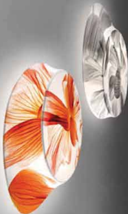
Några väggfasta armaturer i tyg på metallställning i serien Wagashi.