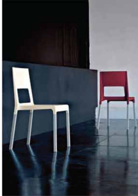
Face, en stol för Kristalia, är gjord i polyuretan och aluminium. Stolen är lätt, stapelbar och har svikt i ryggen. Den mycket rena formen passar hemma såväl som i offentlig miljö.