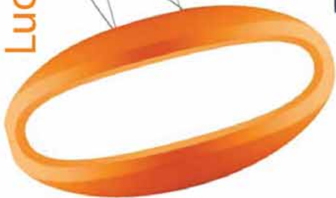
O-space, som funnits ett tag, bländar inte. En graciös pendel med dolda elledningar, från Foscarini.