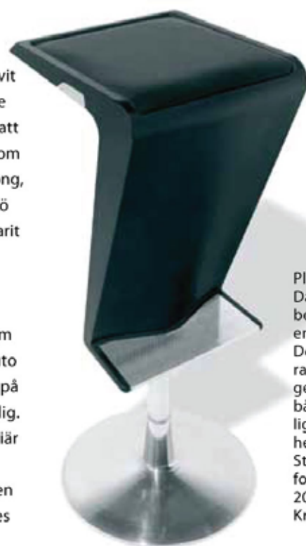
Plaststolen Dart är bekväm med en mjuk sits. Den skulpturala formen ger karaktär både i offentlig miljö och i hemmiljö. Stolen är formgiven 2007 för Kristalia.

– Farfar hade arbetat med muranoglas, en specialitet just för Venedig och jag blev intres