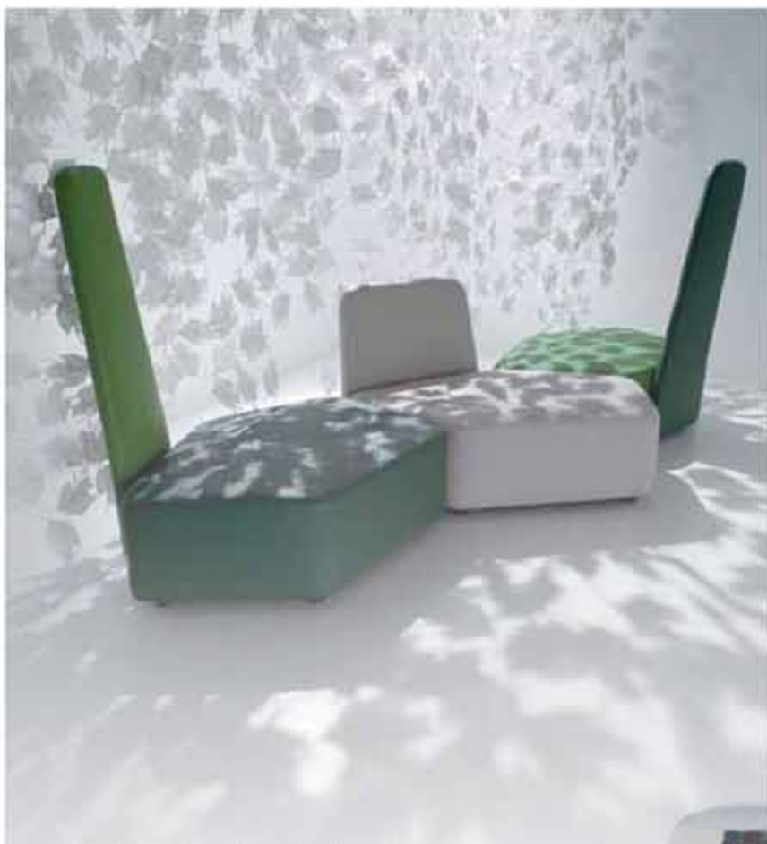
Ben Grimm kallas den originella soffan som man kombinerar som man vill. Design för Casamania by Frezza.