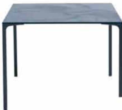
Bordet Blackstone för Moroso står på gracila ben och har en livlig översida i glas och laminerad keramik, med svarta blommor av Massimo Gardone.