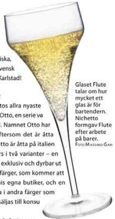
Glaset Flute talar om hur mycket ett glas är för bartendern. Nichetto formgav Flute efter arbete på barer.

Nichetto har fått en rad internationella utmärkelser, till exempel Grand Design Award 2008 och IF Product Design Award samma år. De fina utmärkelserna och en stor, bred produktion ger tillförsikt för framtiden.