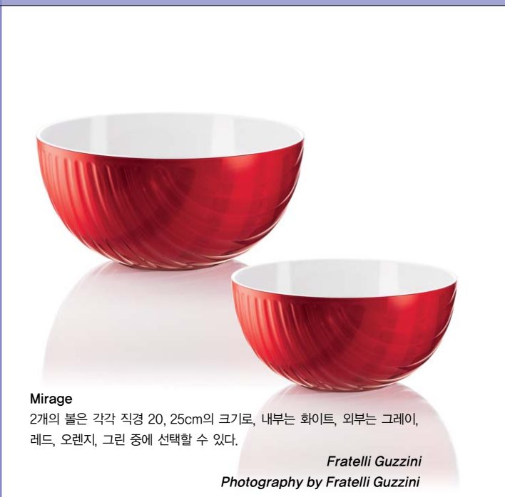
Mirage 2개의 볼은 각각 직경 20, 25cm의 크기로, 내부는 화이트, 외부는 그레이, 레드, 오렌지, 그린 중에 선택할 수 있다.