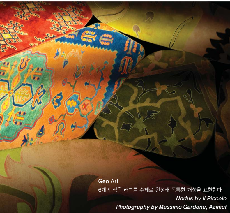
Geo Art 6개의 작은 러그를 수제로 완성해 독특한 개성을 표현한다. Nodus by Il Piccolo