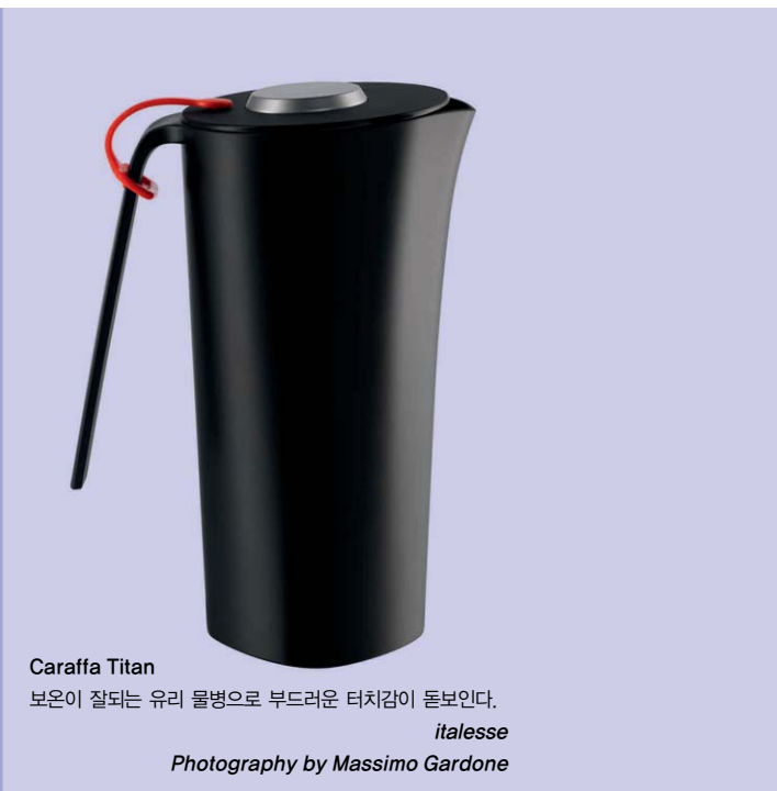
Caraffa Titan 보온이 잘되는 유리 물병으로 부드러운 터치감이 돋보인다. italess