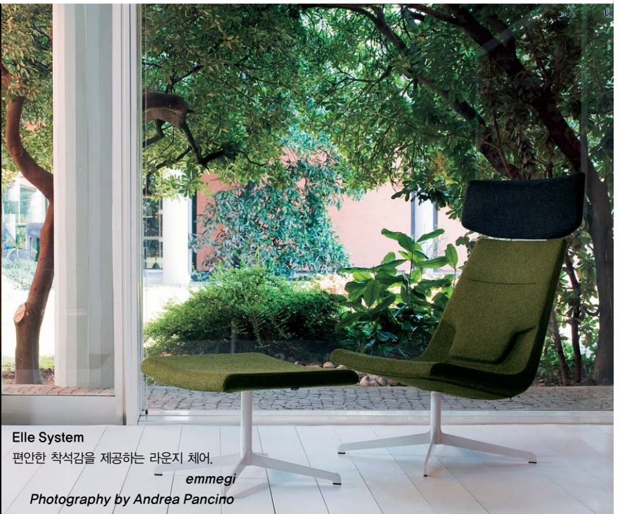
Elle System 편안한 착석감을 제공하는 라운지 체어. emmegi

뿐만 아니라 그는 조명브랜드 FOSCARINI에서 디자인, 신소재 연구와 제품 개발 관련 컨설턴트로 일했으며, 여기에서 기술, 과학과 관련된 지식의 문화적 존엄과 품위를 뜻하는 Forma Mentis를 배울 수 있었다. 이는 수제(手製), 재료의 혁신, 서로 다른 기술의 진보, 삶을 위한 새로운 방식이 두루 반영된 그의 디자인 마인드를 한 단계 업그레이드 시키는 계기가 되었다.