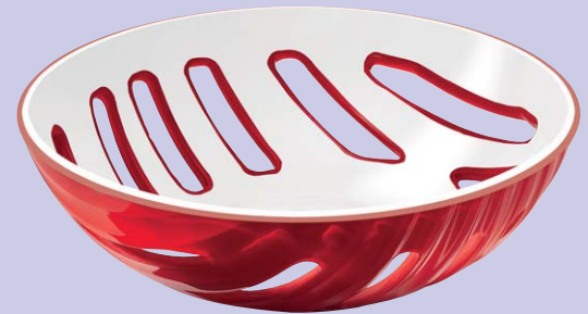
Mirage 아크릴 소재의 주방 용품. Fratelli Guzzini

이러한 경험을 토대로 그는 자신의 디자인 철학에 있어 '탐구'와 '대화'를 특히 중시하게 되었으며, 현재까지도 이 두 가지를 좋은 제품을 완성하기 위한 가장 중요한 단계라고 여긴다. 이에 디자이너는 "나는 내가 고안하는 모든 디자인을 위해, 매우 디테일한 요소들에 이르기까지 섬세하게 탐구한다. 또한 더 나은, 최상의 결과를 도출하고자 제조업자나 클라이언트에게 이러한 내용을 반드시 설명하고 상호 이해관계를 돕는 커뮤니케이션을 중시한다"라고 강조한다. 이처럼 그는 타인과 직접적으로 이야기를 나누거나 혹은 새로운 기술, 소재와 관련된 문제들을 해결해 나가는 과정을 흥미롭게 여기며, 이러한 것들이 올바른 방식으로 디자인에 접근하기 위해 반드시 필요한 시간이라고 생각한다.