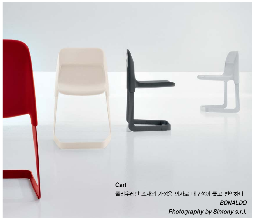
Cart 폴리우레탄 소재의 가정용 의자로 내구성이 좋고 편안하다. BONALDO