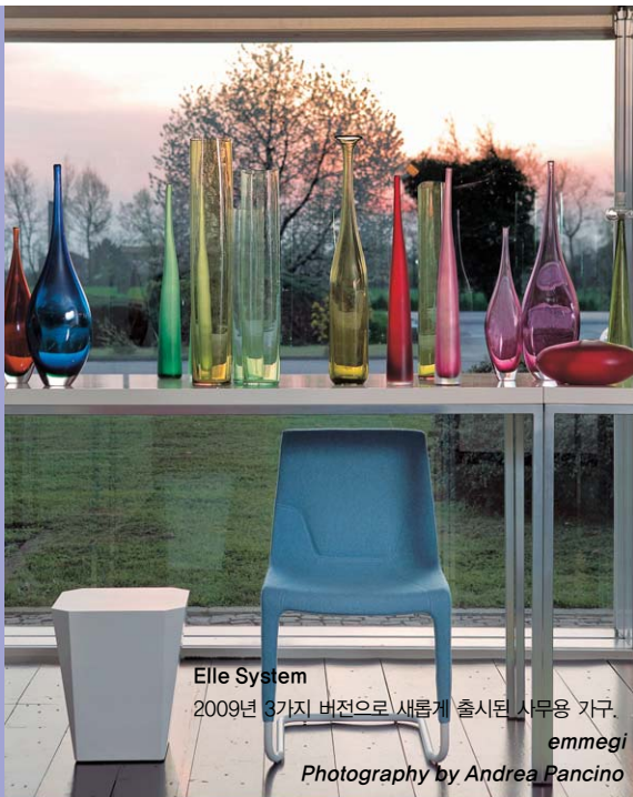
Elle System 2009년 3가지 버전으로 새롭게 출시된 사무용 가구. emmegi