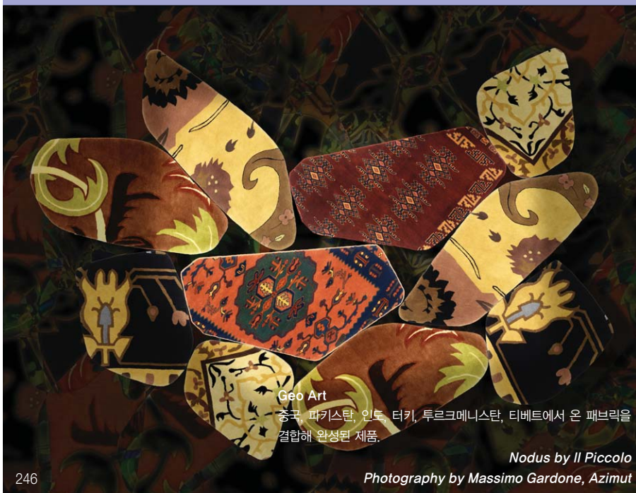
Géo Art 중국, 파키스탄, 인도, 터키, 투르크메니스탄, 티베트에서 온 패브릭을 결합해 완성된 제품.

이러한 경험을 토대로 그는 자신의 디자인 철학에 있어 '탐구'와 '대화'를 특히 중시하게 되었으며, 현재까지도 이 두 가지를 좋은 제품을 완성하기 위한 가장 중요한 단계라고 여긴다. 이에 디자이너는 "나는 내가 고안하는 모든 디자인을 위해, 매우 디테일한 요소들에 이르기까지 섬세하게 탐구한다. 또한 더 나은, 최상의 결과를 도출하고자 제조업자나 클라이언트에게 이러한 내용을 반드시 설명하고 상호 이해관계를 돕는 커뮤니케이션을 중시한다"라고 강조한다. 이처럼 그는 타인과 직접적으로 이야기를 나누거나 혹은 새로운 기술, 소재와 관련된 문제들을 해결해 나가는 과정을 흥미롭게 여기며, 이러한 것들이 올바른 방식으로 디자인에 접근하기 위해 반드시 필요한 시간이라고 생각한다.